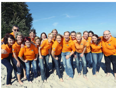
Objekt ID: 90623